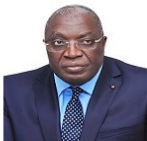
Monsieur Paul Koffi KOFFI Ministre de l'Enseignement Technique et de la Formation Professionnelle